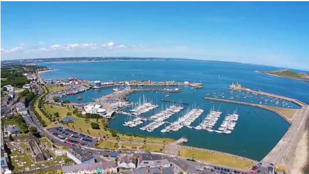
Baia di Howth

Purtroppo non ho avuto il tempo per percorrere i 10 chilometri di sentiero lungo le scogliere di Howth. Una camminata che porta alla località "The Summit", il punto più alto della scogliera (120mt ca.) e all'Head of Howth da dove si possono ammirare stupendi panorami sul villaggio.