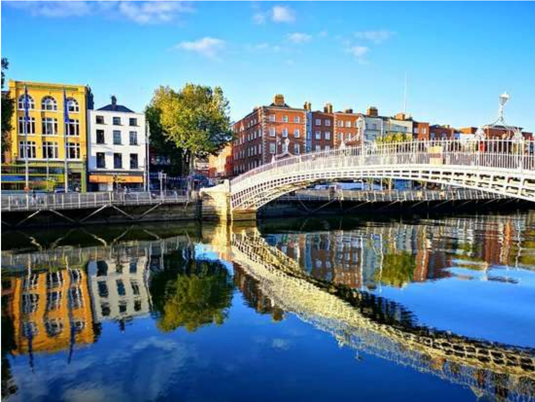
Ha' penny Bridge – River Liffey