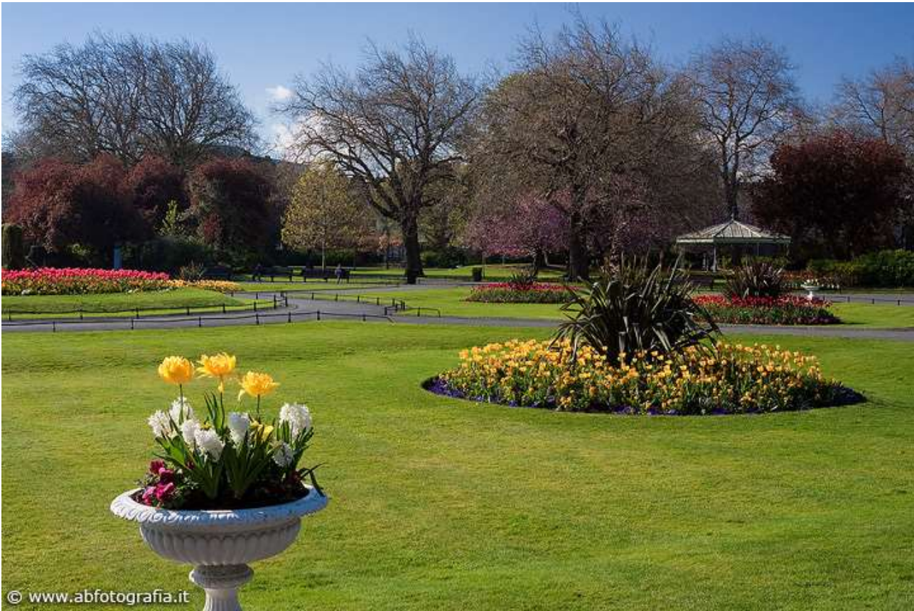
St. Stephen's Green