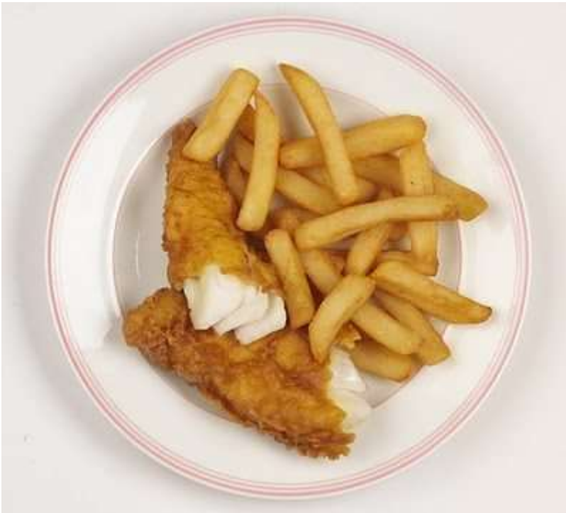
Fish and chips

E' stata veramente una bellissima opportunità che mi ha dato la possibilità di conoscere una terra completamente diversa sia a livello linguistico che culturale, ricca di tradizioni e di incontrare persone cordiali e sorridenti. L' unica "pecca" il lasso di tempo decisamente troppo breve... Un' esperienza sicuramente positiva e stimolante da ripetere!