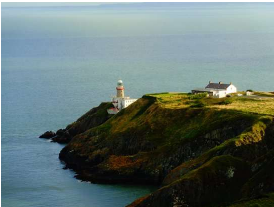
Scogliera di Howth