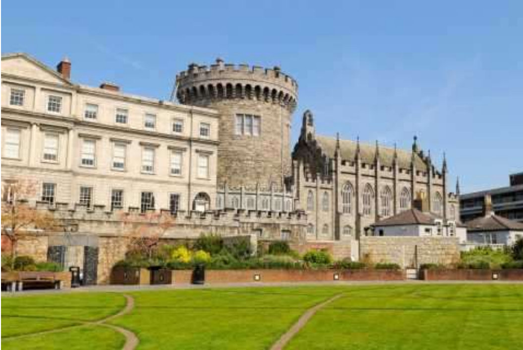
Castello di Dublino