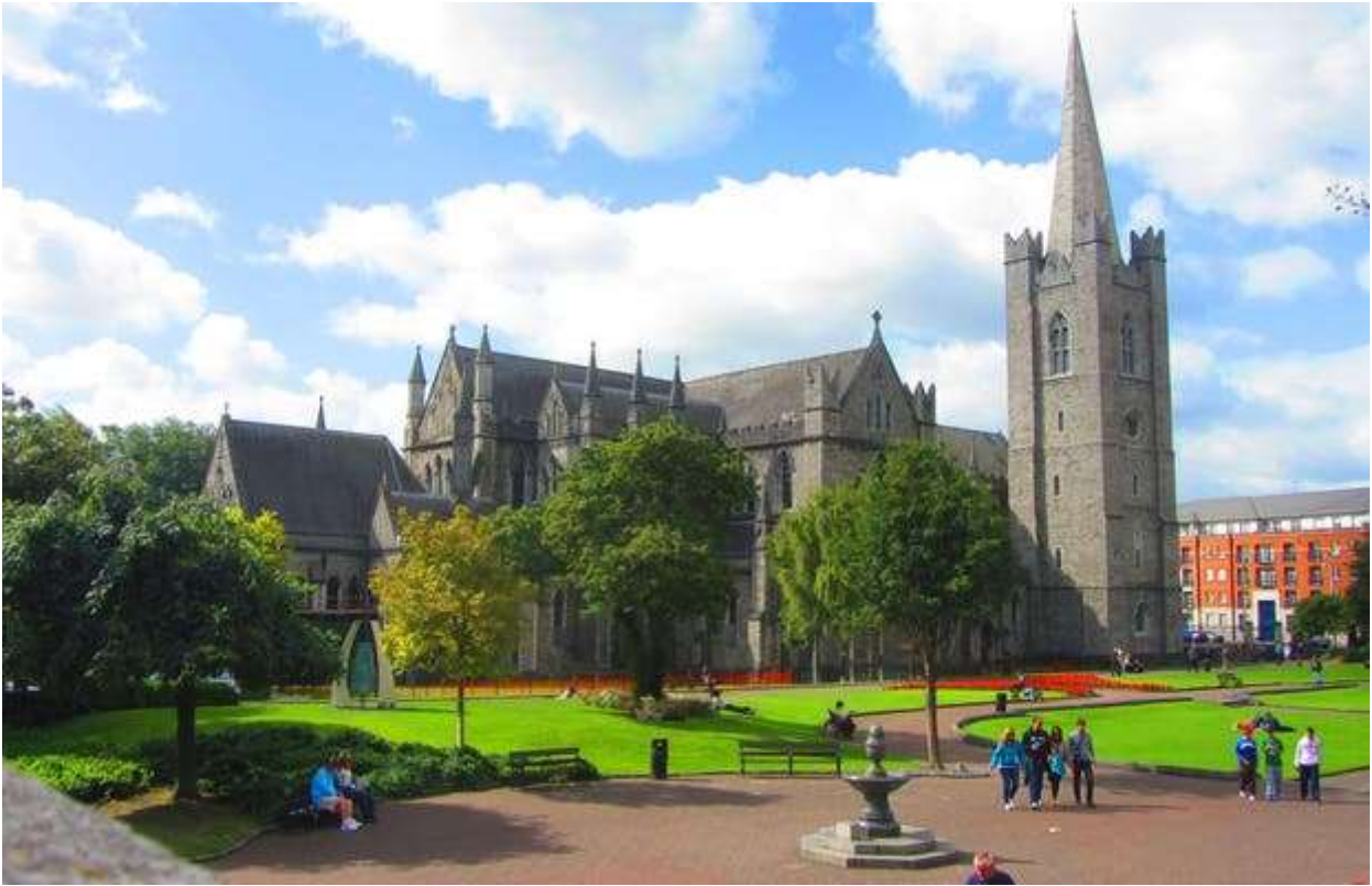
St. Patrick's Cathedral